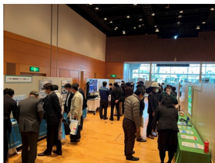
機器展示会場イメージ(令和4年度の様子)