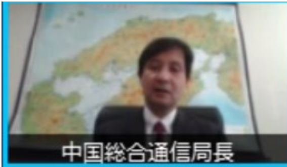
中国総合通信局 和久屋局長挨拶